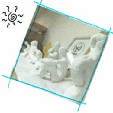
@Sperogram すぺいろう来たよ 糸紙ねんどがいろいろあったヨ♪*